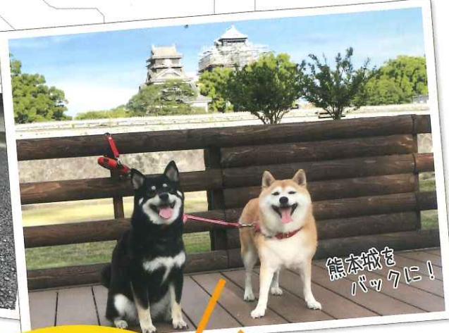
熊本城を バックに!